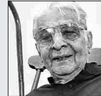
श ज्ञा डे