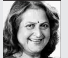
पिं प ल पान