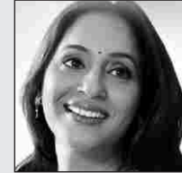
म नो भा वे