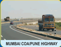
MUMBAI COA/PUNE HIGHWAY