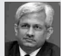
न ब्या दि शे चा शोध