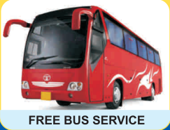
FREE BUS SERVICE