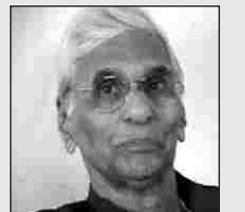
प हिला च हा