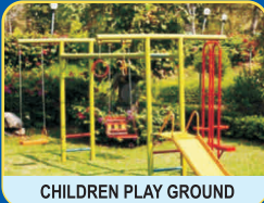
CHILDREN PLAY GROUND