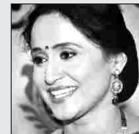
मो र पं स्त्री