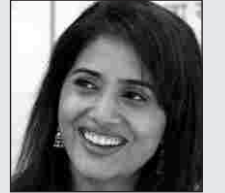
सो कु ल