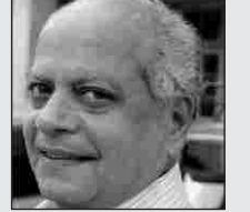
घ ट का गे ली प ले गे ली