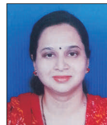
सौ.अधिा अर्विस लेले स्विकृत सदस्य